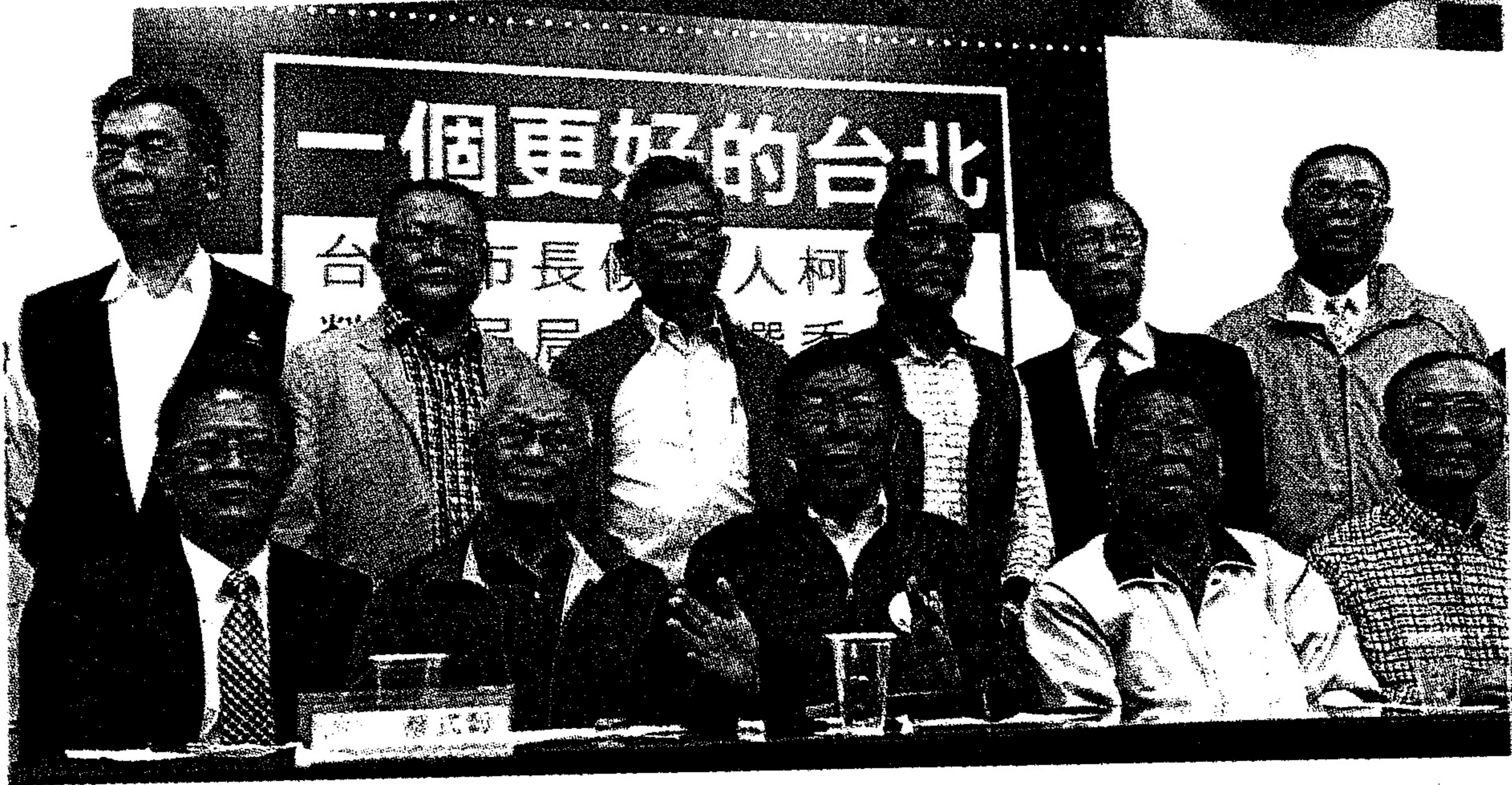
台北市長候選人柯文哲二十日召開記者會，介紹台北市勞動局長遴選委員會成員，並公布遴選勞動局長的辦法。